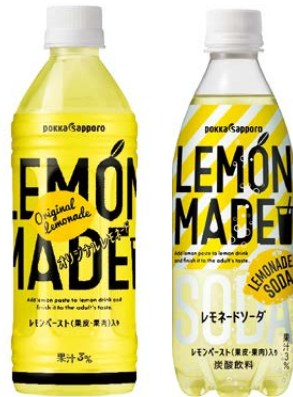
左：2019年6月3日期間限定発売 「LEMON MADE オリジナルレモネード」 右：2019年9月2日期間限定発売 「LEMON MADE レモネードソーダ」