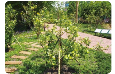
恵比寿ガーデンプレイス「サッポロ広場」 レモンの木植栽コーナー

ポッカサッポロは、2017年に「レモンについてもっと知ってほしい」という想いから、東京本社がある「恵比寿ガーデンプレイス」の「サッポロ広場」に、レモンの木を合計10本植樹しました。これらのレモンの木は、同広場を訪れた人々に見守られながら、台風にも負けずにすくすくと育ち、2019年11月に実が色づき始め、2020年1月には初めての収穫を行いました。恵比寿の街でレモンを育てることで、これからもレモンについての知識を広めていきます。